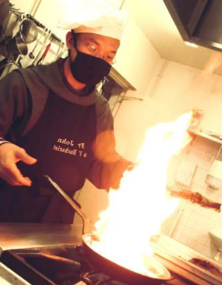
FRÈRE JOHN OF THE EUCHARIST